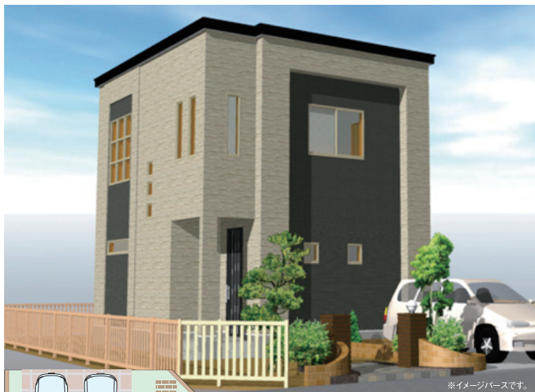
※イメージバースです。